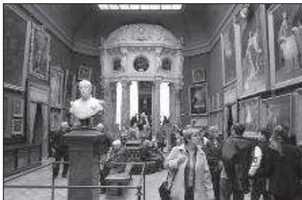
La Galerie des Batailles

Nous voici donc à Chantilly, sous la conduite de deux guides, anglophone et francophone ; nous effectuons la visite du Cabinet des Livres du duc d'Aumale, où sont soigneusement rangés plus de 1300 volumes et 1500 manuscrits, ainsi qu'une multitude de documents, tous cédés à l'Institut de France. Nous parcourons ensuite les grands appartements (l'antichambre, la salle des gardes, la chambre de M. le Prince, la grande singerie, le salon de musique), puis la magnifique Galerie des Batailles de M. le Prince, où de nombreux tableaux retracent les victoires attribuées au prince Louis II de Bourbon-Condé (1621-1686) dit le "Grand Condé".