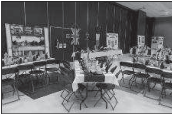
Vue de la salle décorée du dîner du jumelage

Chantilly, bleu et blanc, avait été préparée par les volontaires de notre association, et le traiteur qui nous a cuisiné un remarquable menu. Tous ont été unanimement félicités.