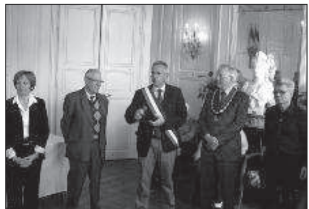
Réception à la Mairie

L'après-midi était laissé libre à la discrétion des familles d'accueil qui avaient organisé différentes balades dans les environs.