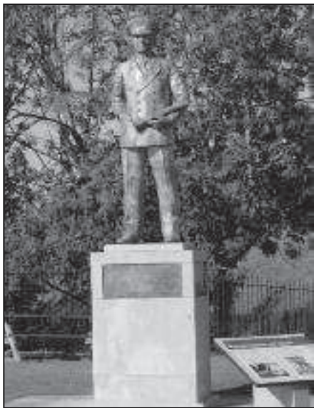
Statue du vice-Amiral Ramsey

Pendant ce temps l'autre groupe découvre l'hôpital souterrain. Mais il est indispensable de rappeler l'objet de la visite réservée à nos amis anglais pour mieux comprendre. Le 10 mai 1940, les armées de Hitler, forçant leur chemin en Europe de l'ouest, prirent en étau la Force Expéditionnaire Britannique, la BEF, et des troupes françaises, à Dunkerque, soit 400 000 hommes. Boulogne tomba, puis Calais. L'évacuation, sous le commandement du Vice-Amiral Ramsey dont la statue se dresse devant la casemate de l'Amirauté, fut ordonnée. Nom de code : Opération Dynamo, exemple d'organisation et d'héroïsme. Sous la couverture aérienne de la Royal Air Force, voiliers, caboteurs, chalutiers encadrés par des navires de guerre, de passagers et de marchandises s'élancèrent de Ramsgate vers la digue ou les plages de Dunkerque où ils étaient pilonnés par les tirs d'artillerie des allemands. Le 3 juin, à la fin des opérations, la BEF dans sa totalité et 139 000 soldats français