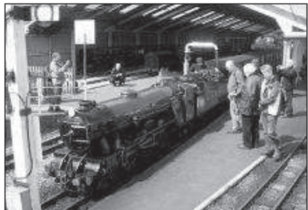
Charmant petit train pour Liliputiens de Dourdan

Le retour ? Abrégeons. Quelques heures de car, un arrêt express dans une station surpeuplée, dans l'attente d'un lit douillet que les « Jeun's » qui travaillent