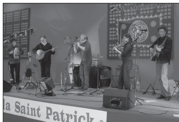
Le groupe Clonakilty