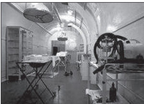
Salle d'opération dans l'hôpital souterrain

Viennent les cuisines à la reconstitution très pédagogique : le foyer, sans conduit de cheminée, les poteries en terre, les quartiers de viande suspendus près du fumoir, les légumes consommés à cette époque, le four à pain récemment remis en état... Mais il ne faut pas